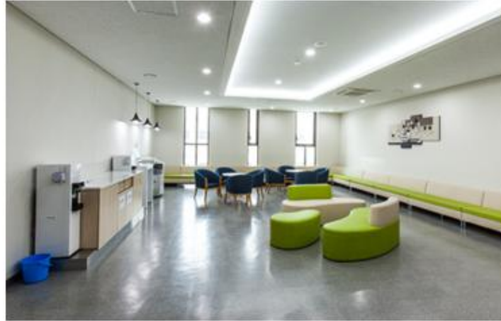
◆ 편의시설 (휴게실 및 노래방)