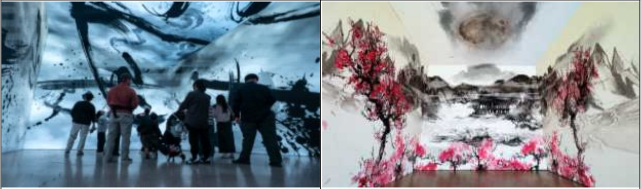
팔복예술공장 디큐브(약 10m*7m*6m)